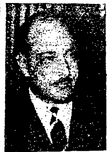
جان - يمثل السيد جان الزعبي وزير الاقتصاد الوطني للشفاة من العملية الجراحية التي اجريت له في مستشفى المعسر، وعلبت المستور ان السيد الزعبي سيغادر المستشفى يوم غد «الاحد».

عمان - ضرب احد سائقي السرفيس في العاصمة اسم ملا وانما عن اصالة المواطن الاردني وتبرف الهنة ان قام بتسلط حذبه بد سناية برنكا احدى الاراضط في سيارته ونحوى على سائق وجذرات برز منها علسي خيسمانه دينار. قد اعلن القتم ابراهيم نزال العمومي مدير شرطة العاصمة ان السيد سبر رجا حداد من السلطوعمل سائق سرفيس على خط جبل الحسين في عمان عن صباح اسم على حقبة يد سناية برنكا مواظمة سوا في سيارته. ولم يفتح المسائق الحقبة بل قام بتسلطها الى الشرطة. ويدين ان العنية تحوي على ١٨١ دينار سناية وخسيسا فاس. بالاضافة الى اساور لدية ورخاخ وقراط وخيبن ويصفي الاقراض الاخرى. واصلت القسم العمومي انه تم معرفة صاحب العنية الحفية وتدعى السيدة جميلة عبد الله طياح من طوكرم وسكان القرعاء وقد نفتحت حقبتها فوجدتها كاملة. وعلت «المستور» ان القواء من ابو نوار مدير الامن العام سينا اليوم السابق على امانته واخلاه.